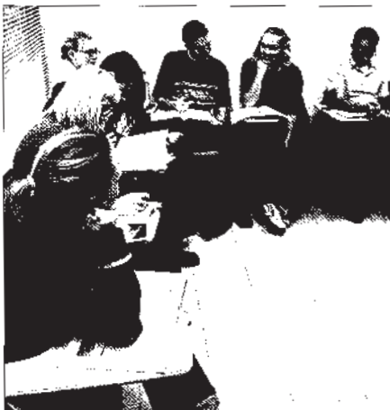
Lengua. Muchos extranjeros eligen Málaga para estudiar español, u.o.