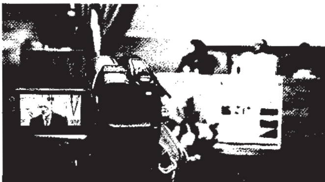
LA PONENCIA. Antonio Gala pronunció desde la sede del Rectorado una charla sobre el sincretismo andaluz.

El escritor cordobés ofreció ayer en Málaga la conferencia inaugural del Congreso Internacional de la Asociación Europea de Profesores de Español